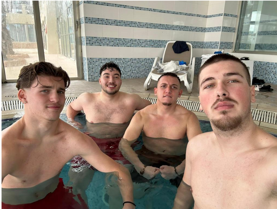
Nach zwei Trainingseinheiten am Donnerstag konnten sich die Jungs im Hallenbad vom Hotel erholen, bevor es dann wieder am Abend das nächste Abendessen gegeben hat.