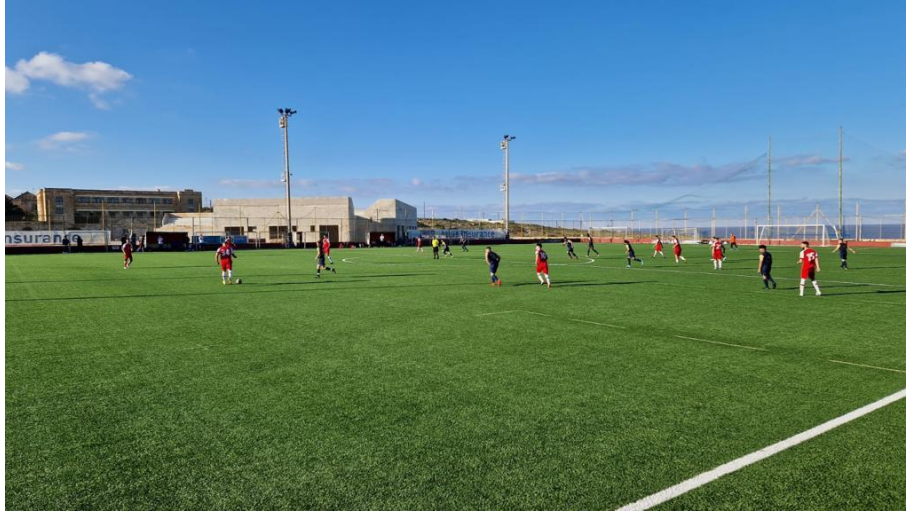
Am Samstagnachmittag, 18. Februar 2023 hatten wir dann das Testspiel gegen FC Kemptthal.