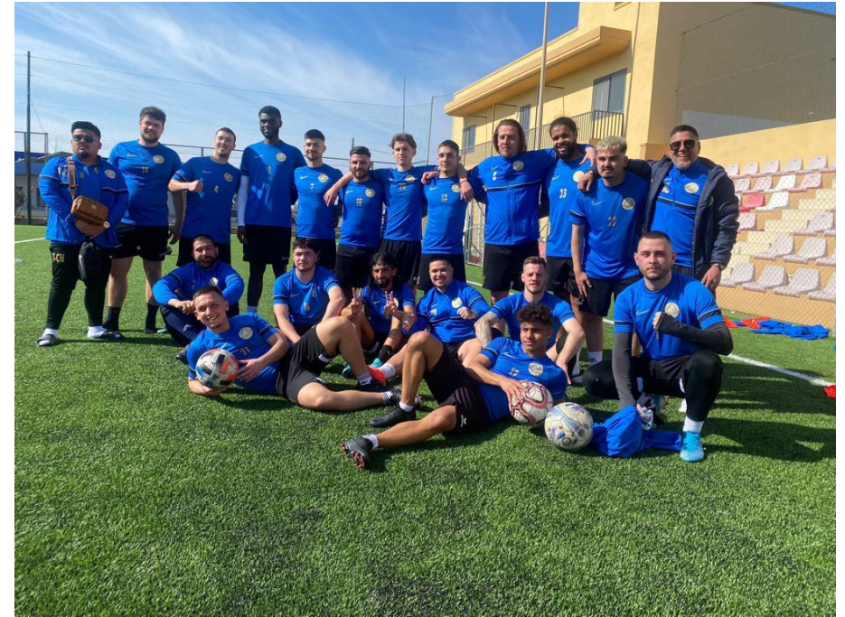
Am Freitagmorgen, 17. Februar 2023 hatten wir wieder eine Trainingseinheit.