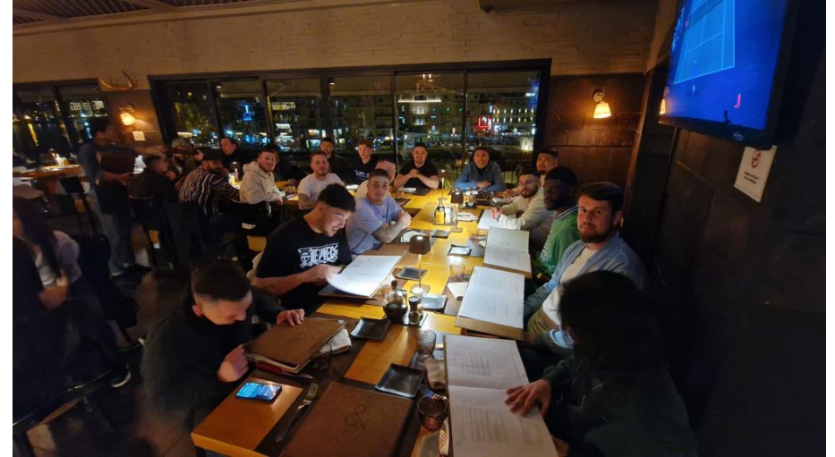
An unserem letzten Abend gingen wir ins Steakhouse Abendessen. Wir haben zusammen den Abend genossen und für den einen oder anderen ging es dann weiter in den Ausgang.